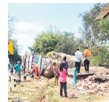
सरना चौक के पास चालक वाहन पर नियंत्रण खो बैठा और ट्रक सीधे यात्री

प्राप्त जानकारी के अनुसार भानुप्रतापपुर से तेंदूपत्ता लोड कर पश्चिम बंगाल की ओर जा रहा ट्रक क्रमांक सीजी 07 एवाई 8010 स्टेट हाईवे पर तेज गति से चल रहा था। प्रत्यक्षदर्शियों ने बताया कि ट्रक रास्ते भर लहराते हुए चल रहा था। अंडील