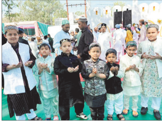
ईद की नमाज अता करते समाज के लोग।